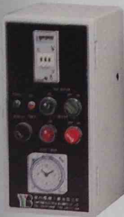
附計時器 (T) 24 Hours / 7 Days Timer