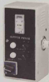
歐規(CE) CE Approval