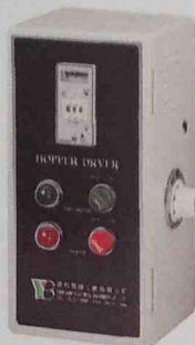
防超溫保護裝置(P) EGO Overheat Protector